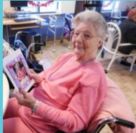
Un residente celebrando el Día de San Valentín en Absecon Manor (Absecon, Nueva Jersey)