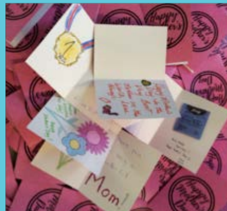
Tarjetas del Día de las Madres