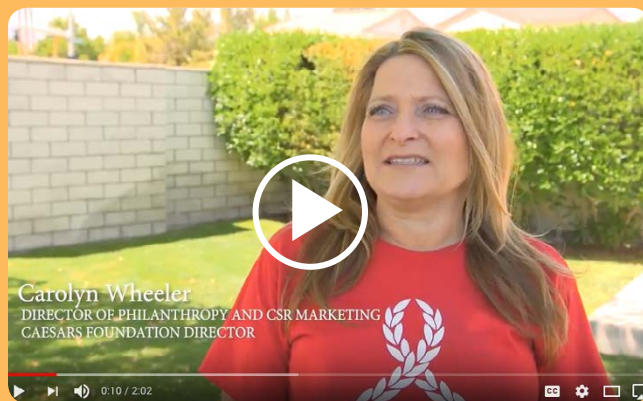
Mira como Caesars Foundation está comprometido con las personas mayores locales con nuestra relación con Meals on Wheels of America. Watch video.